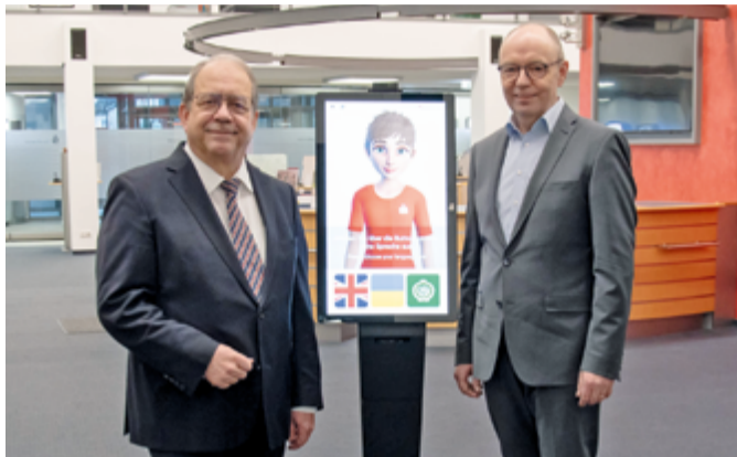
Bei digitalen Services für unsere Kundinnen und Kunden immer vorn dabei.

die Sprachassistentin „Kim“ bietet mittlerweile seit einigen Wochen in unserer Hauptstelle Olpe einen wertvollen Service, damit auch fremdsprachige Kundinnen und Kunden ihre Finanzgeschäfte gut und zuverlässig regeln können. In neun Sprachen werden wichtige Funktionen erklärt, um z. B. Online-Banking auf dem Smartphone einrichten zu können. Unsere Sparkasse ist damit die erste in Südwestfalen und die zweite in NRW, die diesen modernen Kundenservice einsetzt. Sie werden noch weitere Berichte in dieser Ausgabe von „S im mittelpunkt“ lesen, bei denen die Sparkasse auf digitale Services setzt. Kundinnen und Kunden erhalten damit in diesen verwirrenden Zeiten Unterstützung, die eigenen Finanzen einfach zu ordnen und zu verstehen. Selbstverständlich sind unsere qualifizierten Beraterinnen und Berater jederzeit für Sie da. Sie sind