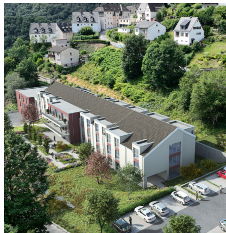
Der moderne Neubau wird über 80 Pflegeappartements als komfortable und barrierefreie Einzelzimmer bieten.