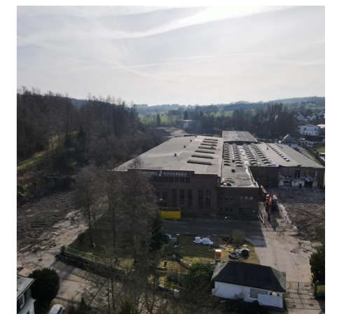
Der Anblick der ehemaligen Industriehallen wird schon bald der Vergangenheit angehören.

Das ehemalige Industriegelände umfasst eine Fläche von ca. 28.000 qm , der dazugehörige, frühere Mitarbeiterparkplatz in unmittelbarer Nähe zur Wohnbebauung der Ortslage Rothemühle eine Fläche von rund 9.100 qm . Die Vermarktung der Gewerbeflächen und der Wohnbebauung beginnt in Kürze. Interessiert? Dann melden Sie sich gern – auch in Sachen Finanzierung.